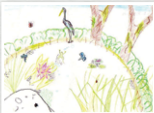
Poème et dessin réalisés par les élèves de CE2 de l'école Roger Salengro de Lumbres.